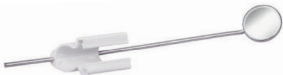
Kombihalter mit Kehlkopfspiegel Combination holder with laryngeal mirror