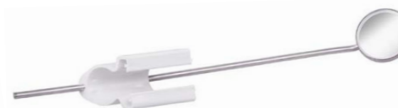
Kombihalter mit Kehlkopfspiegel Combination holder with laryngeal mirror